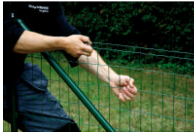
Ausrollen und Ziehen Drahtzaun