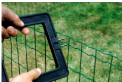
Nachspannen mit Spannwerkzeug