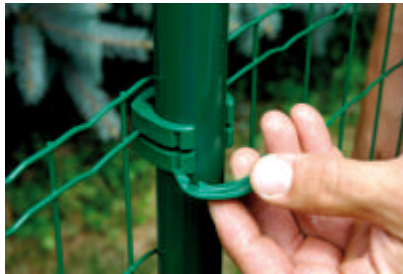
Aufsetzen Sicherungsfeder auf Clip